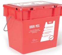
Ein boks til å samle miljøfarleg avfall i.