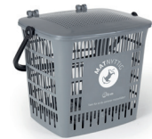
Matkorg til å samle matavfall i inne.